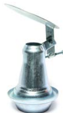
RASPRSKIVAČ ZA OSOKU