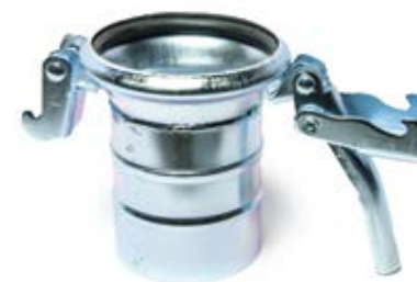
ŽENSKA SPOJKA SA KUKAMA ZA CREVO