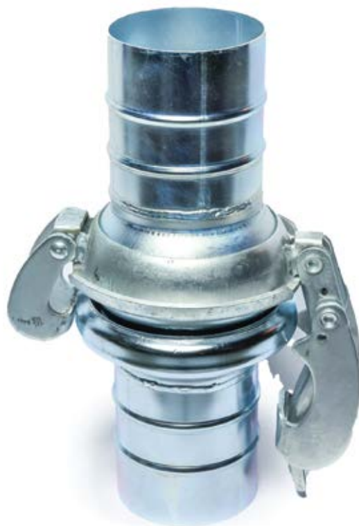
BAUER KANDŽASTA SPOJNICA