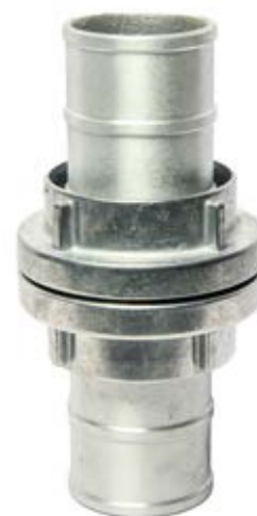
ALUMINIJUMSKA (VATROGASNA) SPOJKA