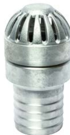
ALUMINIJUMSKA USISNA KORPA