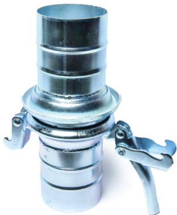
FERARI KANDŽASTA SPOJNICA