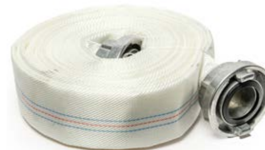
TREVIR VATROGASNO CREVO