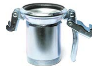
ŽENSKA SPOJKA SA NAVOJEM