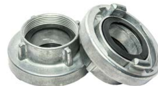
ALUMINIJUMSKA STABILNA SPOJKA