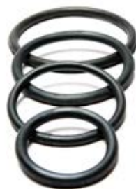
GUMICE ZA KANDŽASTE SPOJKE