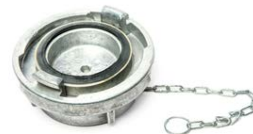
ALUMINIJUMSKA ČEP SPOJKA