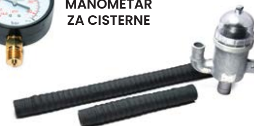
VAKUUM CREVA I KOMPLETAN TALOŽNIK