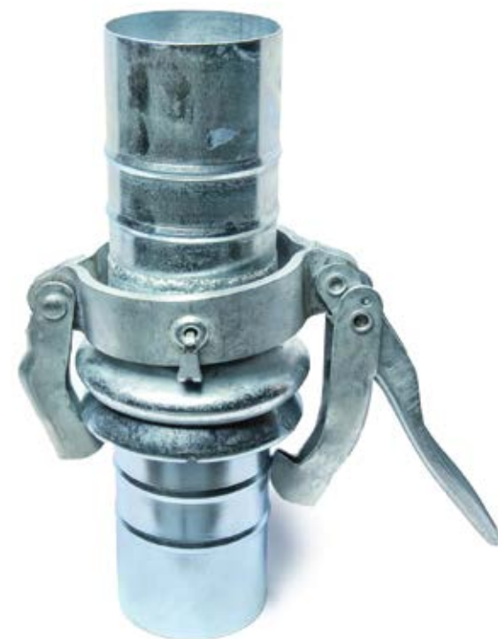
PERROT KANDŽASTA SPOJNICA