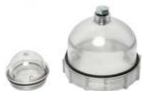
KONTROLNO OKO I ČAŠA TALOŽNIKA