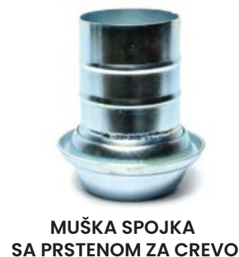
MUŠKA SPOJKA SA PRSTENOM ZA CREVO