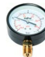
MANOMETAR ZA CISTERNE